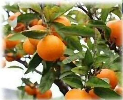
オレンジパーク串良