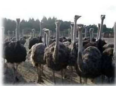
鹿屋オーストリッチ牧場 (ダチョウ200羽)