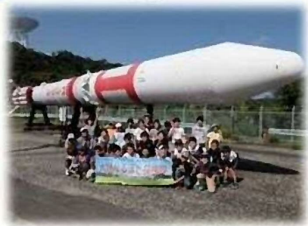
内之浦宇宙空間観測所