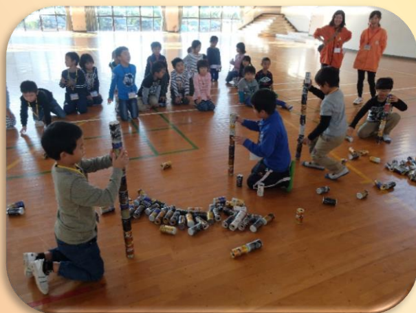
遊びリンピック！（空き缶積みなど）