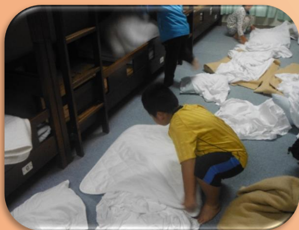
生活体験（自分のことは自分です。）