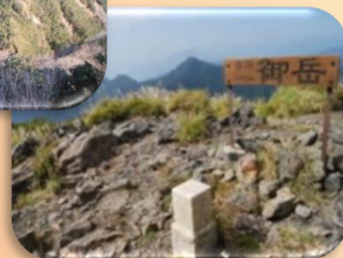
御岳登山へチャレンジ！（秋山を探検）