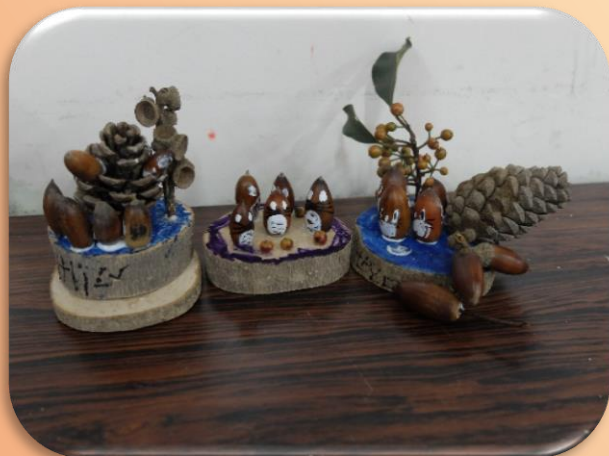
秋さがし！（どんぐり拾い・クラフト）