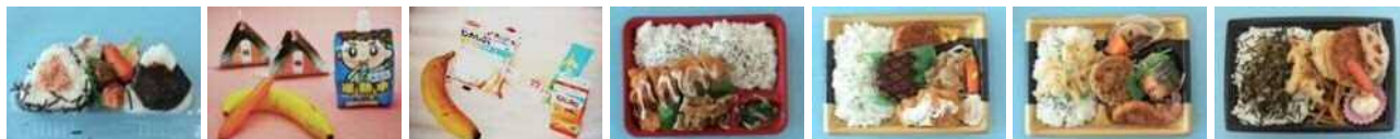
おにぎり弁当 ハイキング弁当 パン弁当 ボリューム弁当 洋風弁当 和風弁当 高菜弁当