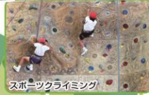
スポーツクライミング