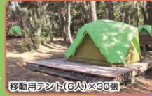
移動用テント(6人)×30張