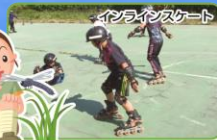
インラインスケート