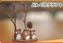
どんぐりクラフト