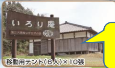
移動用テント(6人)×10張