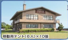
移動用テント(6人)×10張