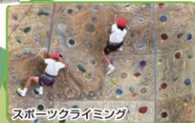
スポーツクライミング