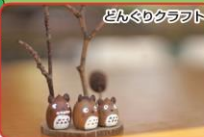
どんぐりクラフト