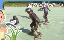
インラインスケート